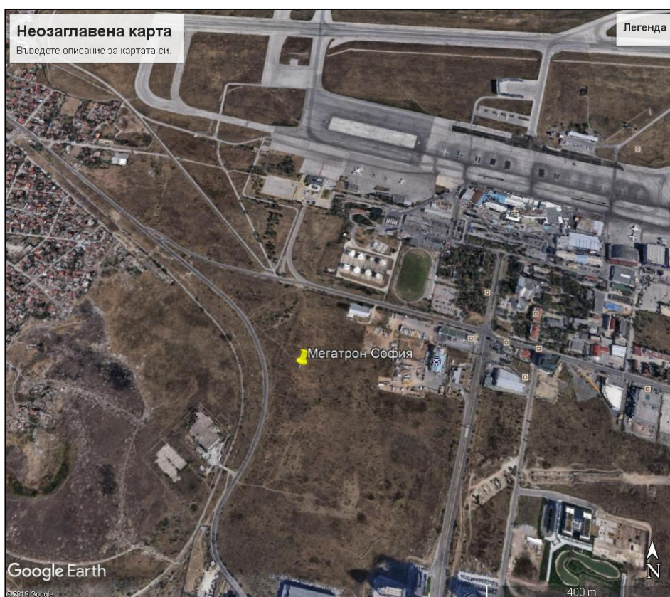
Фиг. 1. Местоположение на тръбния кладенец

Захранването на обекта с електроенергия ще бъде осъществено от електропреносната мрежа.