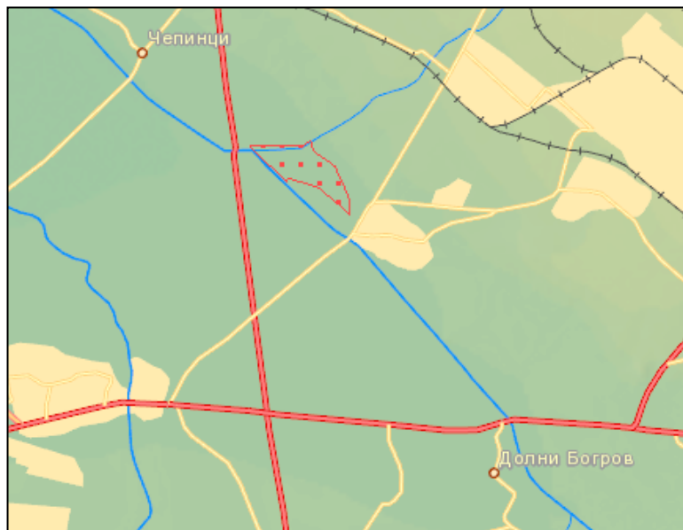
Фиг. 4. Карта на защитена зона „Рибарници Челопечене“ с код BG 0002114

Втората е с код BG 0002114 «Рибарници Челопечене» по Директива 79/409/ЕЕС за запазване на площта на природните местообитания и местообитанията на видовете и техните популации, отстои на около 7700м. от поземления имот (фиг. 4).